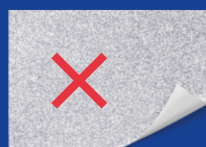
Бумагу с вкраплениями