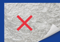
Со слоем фольги, воска и ламинации