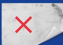
Грязную и мокрую бумагу