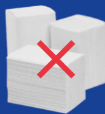
Салфетки и бумажные полотенца