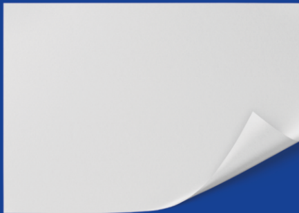
Белую офисную бумагу